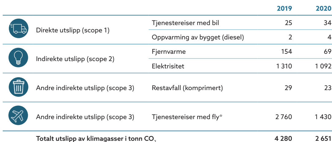
Tabell 4 Utslipp av klimagasser målt i tonn CO 2