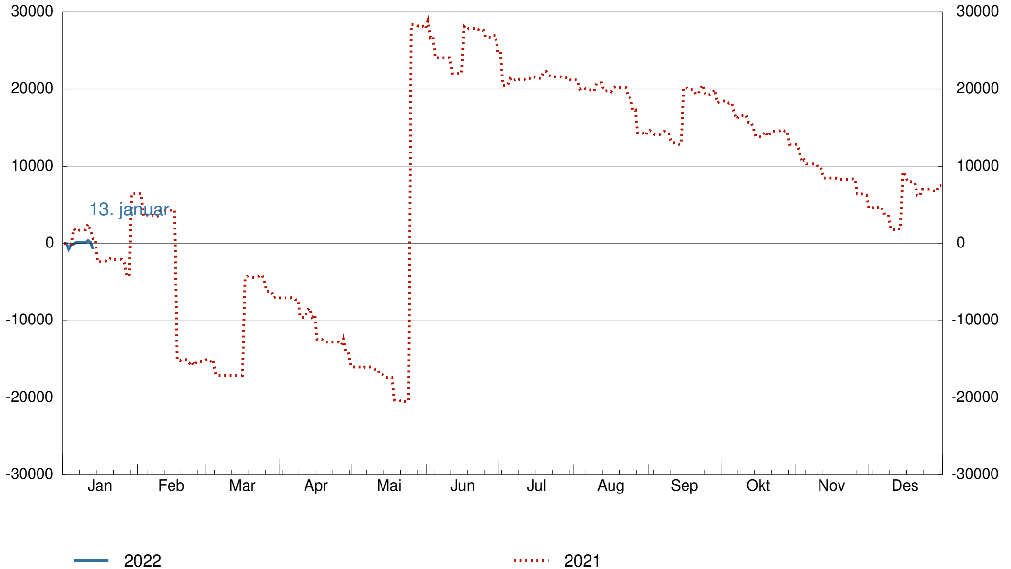
Figur 2. Netto likviditetstilførsel ved statspapirer, akkumulert fra 1. januar, millioner kroner