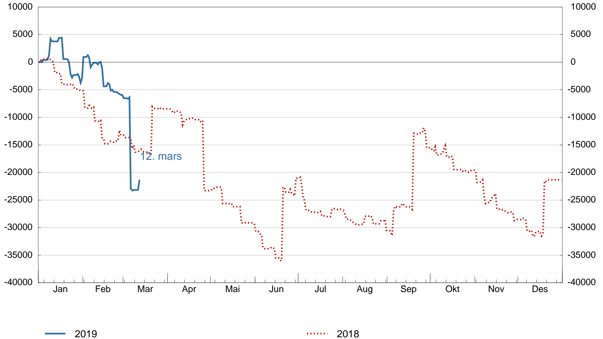
Figur 2. Netto likviditetstilførsel ved statspapirer, akkumulert fra 1. januar, millioner kroner