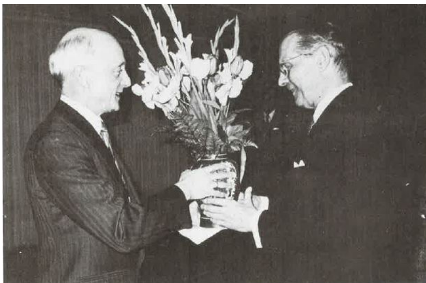
Statsministeren overrekker blomsterhilsen fra Regjeringen ved mottakelsen på Continental 19. mars 1985