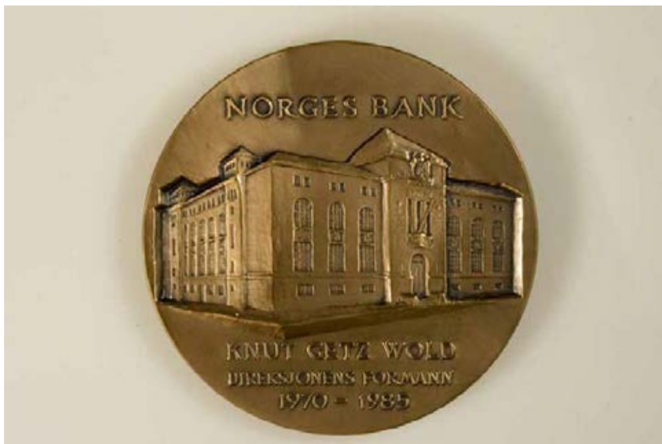
(b) Norges Bank

Bilde 14 Knut Getz Wold var formann i direksjonen for Norges Bank fra 1970 til 1985. I forbindelse med Getz Wolds avgang i 1985 ble det laget medalje med hans portrett. Baksiden av medaljen viste Norges Banks hovedsete med inskripsjon. Formgiver: Øivind Hansen.