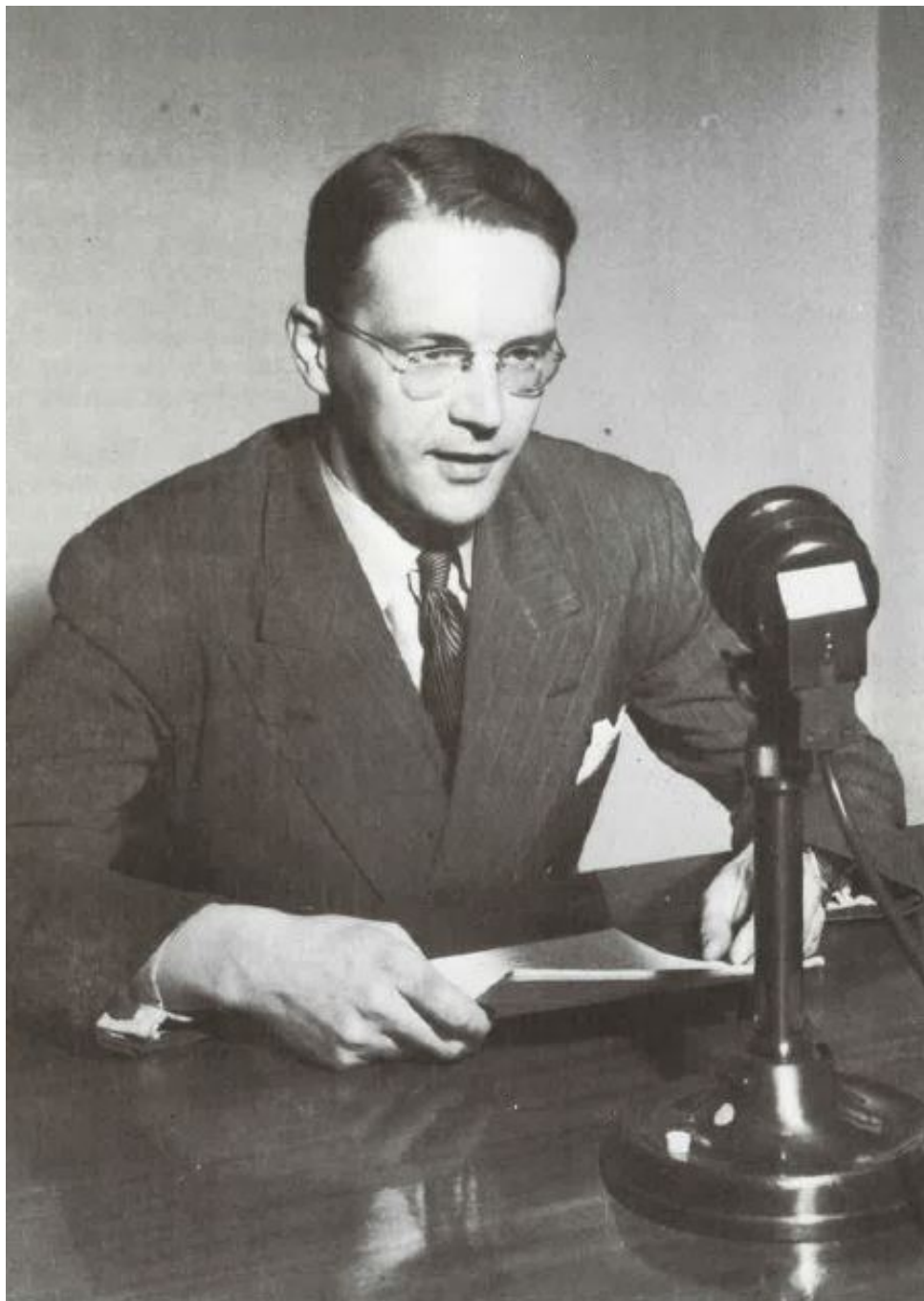
Bilde 4 Økonomisk kvarter i NRK 1949.