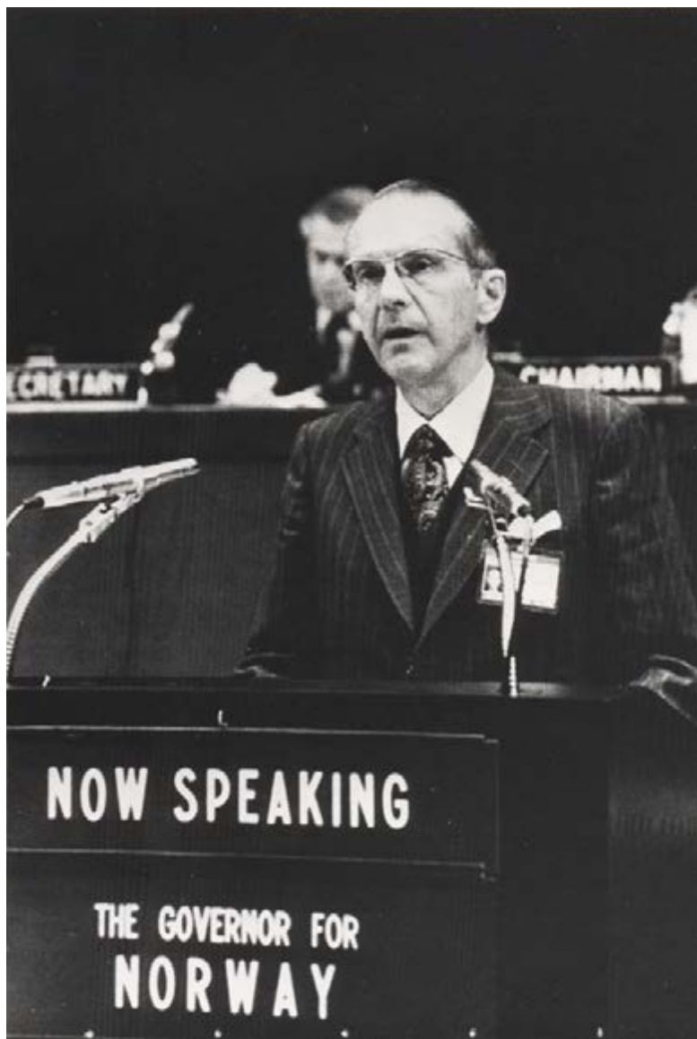
Bilde 11 Governor Knut Getz Wold taler på årsmøtet i det Internasjonale valutafondet 10. april 1979.

blikkens nåværende president Koivisto var tidligere Finlands Banks sjef. Og hans etterfølger Karjalainen var en sterk kandidat til presidentembetet.