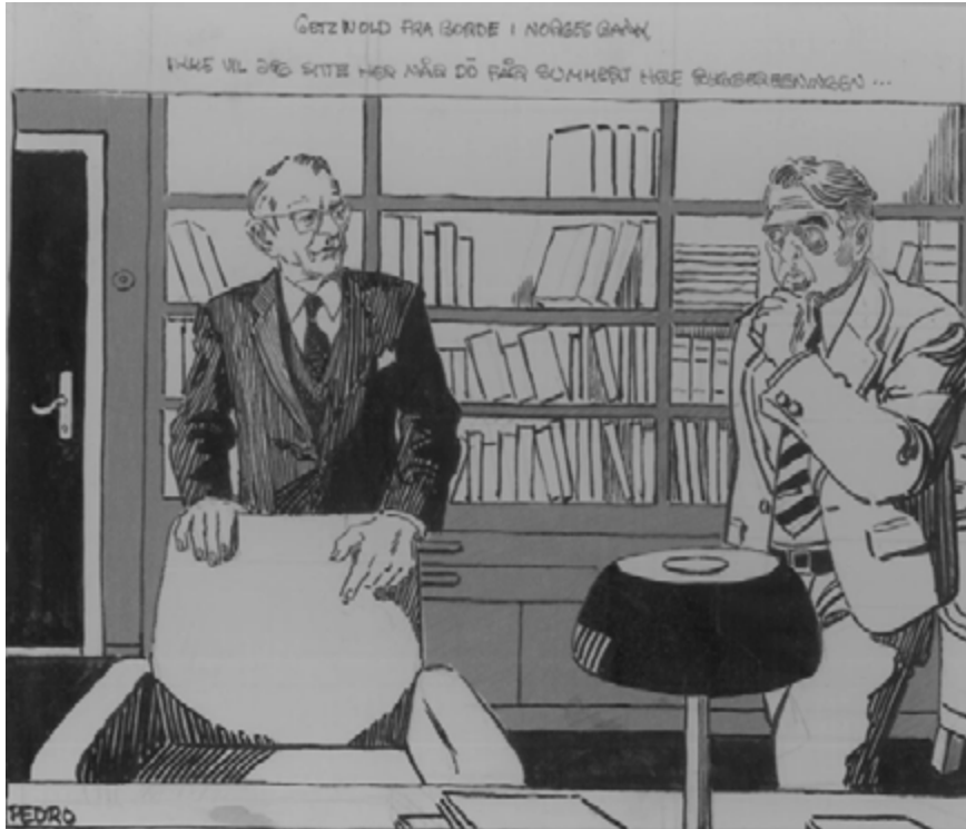
Bilde 15 VGs illustrasjon av Knut Getz Wold og Hermod Skånland 6. august 1984. Tegning : Pedro / VG.

Det eneste problem han har hatt med Finansdepartementet, er at dette toppes av en finansråd (Eivind Erichsen) som rett og slett elsker tidlige møter. Og Getz Wold - ja, man trenger ikke være direkte syvsover for å synes at halv åtte i departementet er bra tidlig.